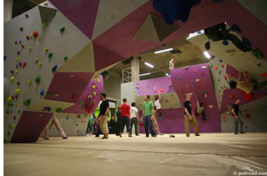
Migros vitamin parc, Neydens, France