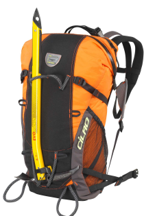
iZi 33 725 g / 33 litres

Auf dem selben Wege gewinnen die Rucksäcke an Terrain, aufgrund des exklusiven Tragekonzepts, des Air-go Konzepts (Patent CiLao) : die Träger aus Doppelriemen tragen zu einem ganz besonderen Tragekomfort und zur Stabilität bei (Verteilung der Last auf die beiden Riemen). Sie lassen sich mit der durchdachten Palette an iZi Riemen und Taschen ausstatten.