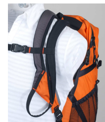
air-go concept by CiLao

Auf dem selben Wege gewinnen die Rucksäcke an Terrain, aufgrund des exklusiven Tragekonzepts, des Air-go Konzepts (Patent CiLao) : die Träger aus Doppelriemen tragen zu einem ganz besonderen Tragekomfort und zur Stabilität bei (Verteilung der Last auf die beiden Riemen). Sie lassen sich mit der durchdachten Palette an iZi Riemen und Taschen ausstatten.