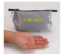
OZ 22 EXPERT 145 g