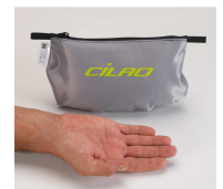
OZ 22 EXPERT 145 g