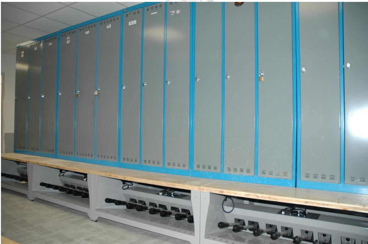
Skischränke und Schuhtrockenbänke in einer Skischule

Die Produkte KORALP findet man ebenfalls im professionellen Bereich, wie in Skischulen und Seilbahnen und werden unter der Marke KORALP EXPERT vertrieben.