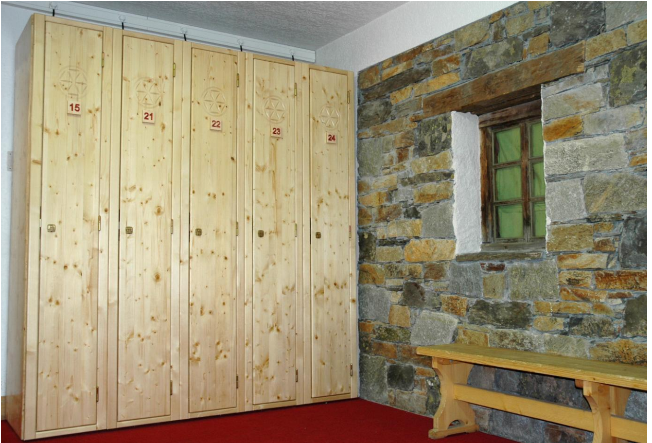
Skiraum in einem Hotel

Unter der Marke KORALP LODGE bietet das Unternehmen KORALP den Hotels, Chalets und Residenzen in den Skistationen Skiraumausrüstungen nach Wunsch an.