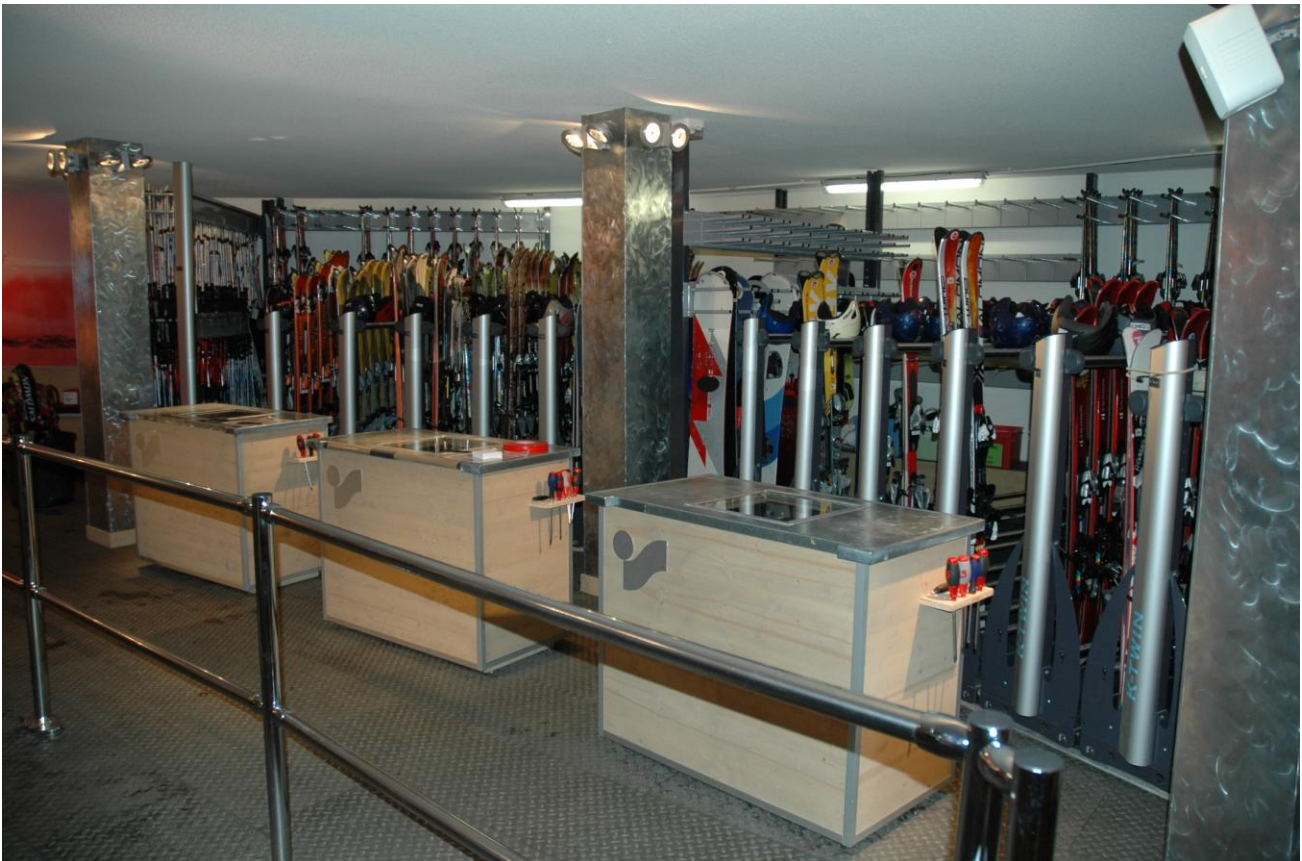
Komplette Einrichtung in einem Skiverleihgeschäft

Unter der Marke KORALP PROSHOP bietet das Unternehmen Sport- und Skiverleihgeschäften Trocken- und Lagerungssysteme für Skimaterial an.